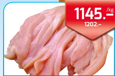
Csirkecomb lédig vcs.